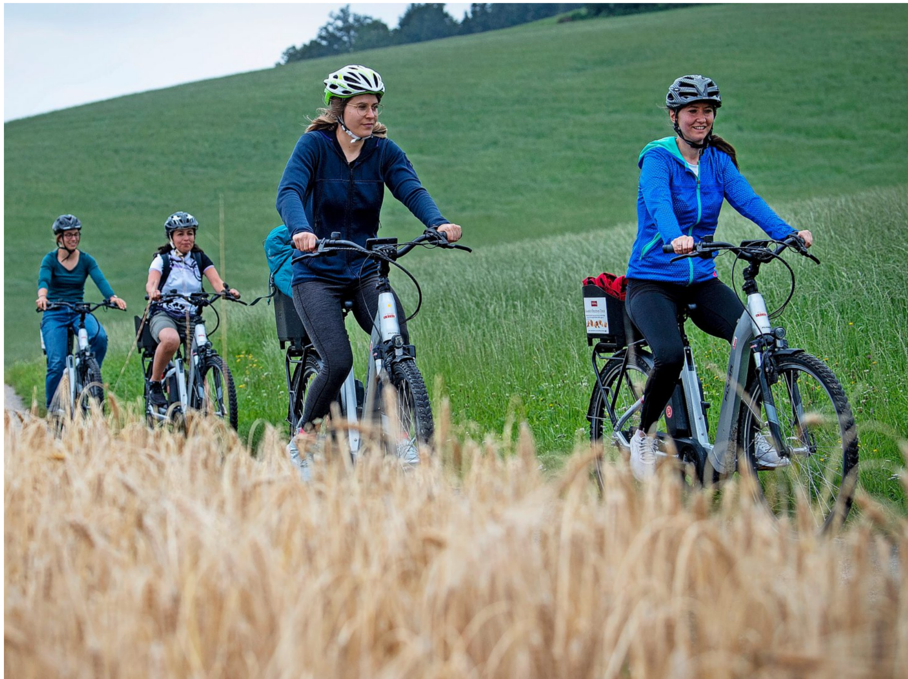
Über tausend Höhenmeter nehmen die E-Bikerinnen auf der Herzschlaufe Burgdorf im hügeligen Gelände in Angriff.

Genussmenschen ansprechen Auch das Informationsbüro von Emmental Tourismus spürt den Andrang. «Wir haben so viele Anfragen wie noch nie», sagt Isabelle Hollenstein, Leiterin von Emmental Tourismus. Seit April sind vier neue Tagesrouten und seit Mai zwei weitere Rundschlaufen ab Burgdorf lanciert. Insgesamt kann man auf über 450 Kilometern beschilderten Strecken durchs Emmental düsen. Eines der Ziele von «Hügu Himu» sei, nicht nur sportliche Velobegeisterte anzulocken, sondern Genussmenschen. «Wir wollen Leute ansprechen, die