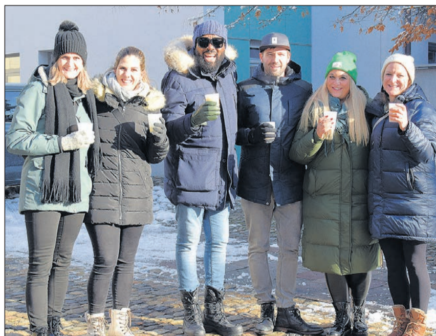
Der Adventsmarkt zog zahlreiche Besucherinnen und Besucher an.