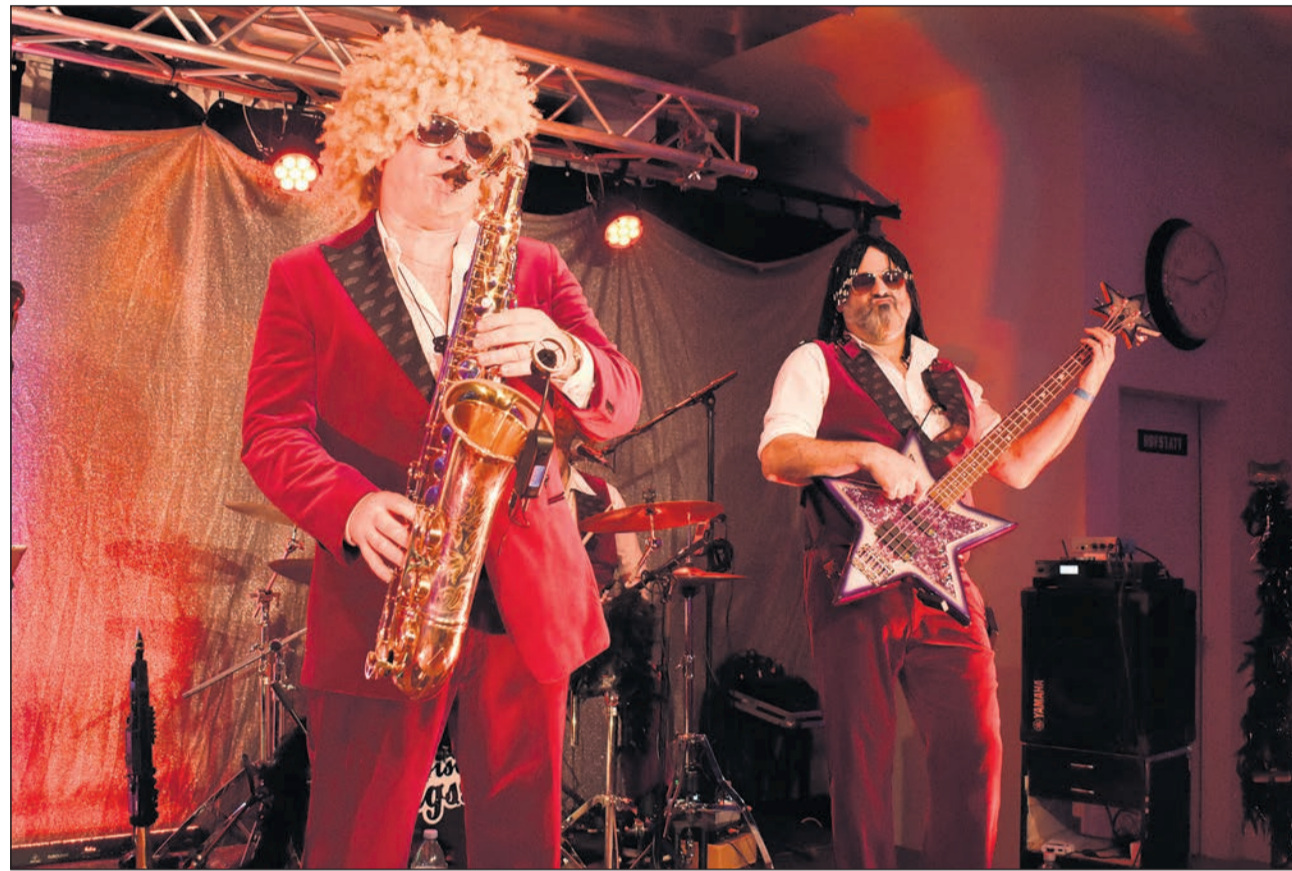
Mit ihrem heiteren und fetzigen Songrepertoire sorgten die «Disco Kings» für beste Stimmung in der PflugFabrik.

Die PflugFabrik ganz im Zeichen der Funk-, Soul- und Popmusik der Siebziger- und Achtzigerjahre, so die Affiche von vergangenem Wochenende im überregional bekannten Zentrum für Business, Kultur und Events. «Diese Songs, das ist meine Genera-