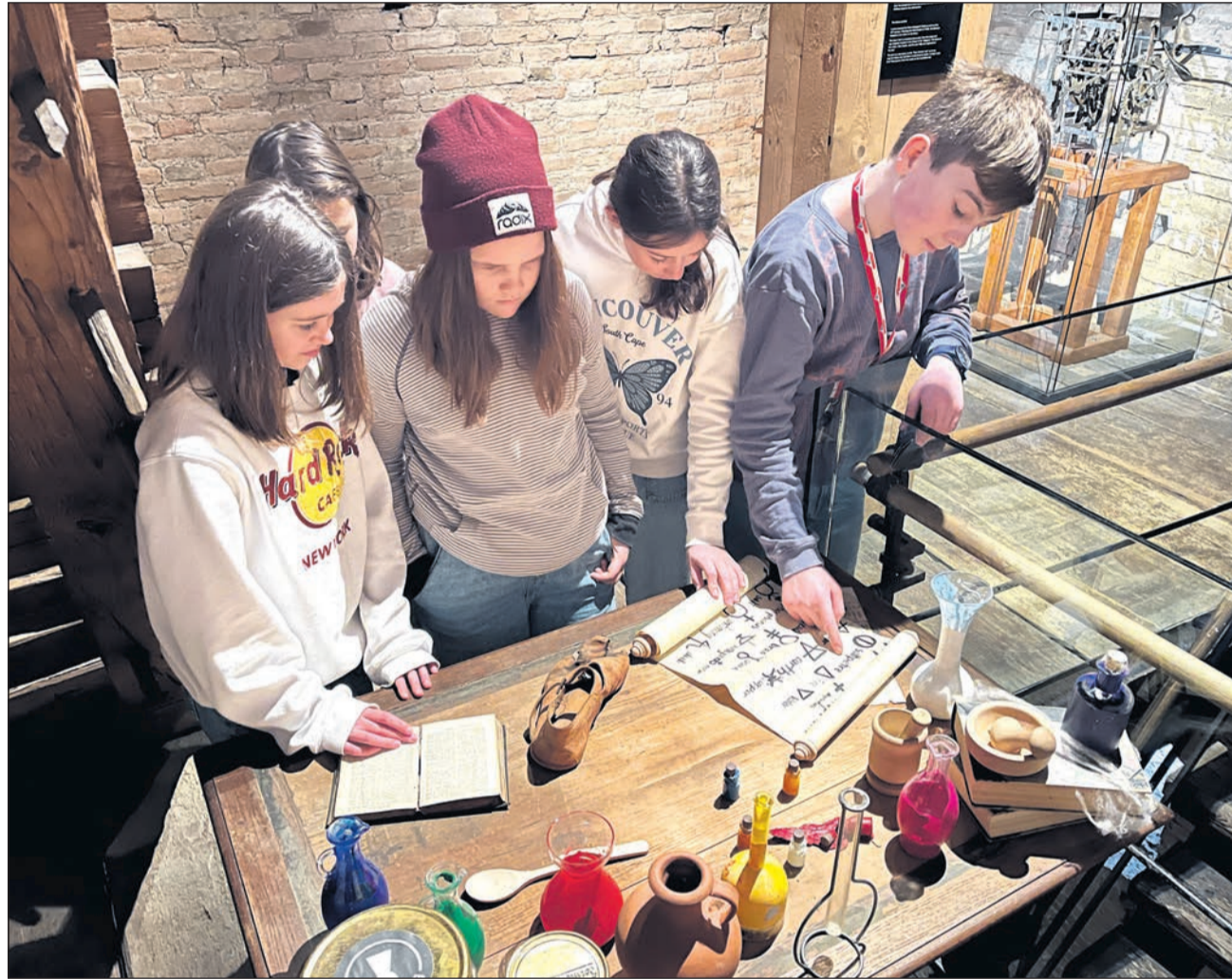
In mehreren Workshops haben die Kinder und Jugendlichen die Escape Tour erstellt.