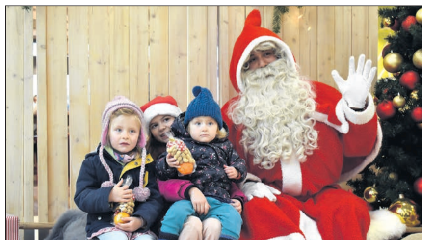
red Der Samichlous war beispielsweise im Neumarkt Burgdorf präsent.

Mit dem Beginn des Dezembers wurde die Advents- und Weihnachtszeit eingeläutet. Schöne Dekorationen und Lichterketten versprühen in der ganzen Region Weihnachtszauber, Weihnachtsmärkte sorgen für Geselligkeit in der besinnlichsten Zeit des Jahres und spätestens seit dem «Samichlouse-Tag» am vergangenen Mittwoch ist wohl jede und jeder in der schönen Weihnachtszeit angekommen. Der Advent und die nahenden Festtage machen sich auch beim Lesen der aktuellen «D'REGION»-Ausgabe bemerkbar.