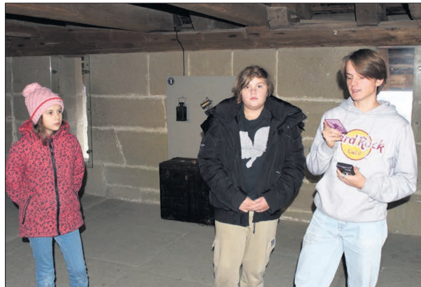
Die Kinder und Jugendlichen führten durch die von ihnen erstellte, knifflige Escape Tour.

Ein uralter Fluch verursacht in der Zähringerstadt immer wieder Brandkatastrophen. Mit einem mysteriösen Tarot-Kartenset gilt es unterschiedliche Artefakte in den beeindruckenden, jahrhundertealten Räumlichkeiten des Schlosses Burgdorf zu sammeln, Hinweise zu kombinieren, Rätsel zu lösen und so schliesslich besagten mystischen Fluch zu bezwingen – so die Ausgangslage der neuen Escape Tour. Die gelungene Tour, angelehnt an die beliebten Escape Rooms oder Exit-Spiele, wurde von Kindern und Jugendlichen im Alter von 10 bis 17 Jahren entwickelt. Im Rahmen des Projekts «Schlosskids» wurde die Idee dazu ab März 2023 in verschiedenen Workshops entwickelt und schliesslich mittels einem Ferienpass-Angebot mit der Hilfe von Fachpersonen und Escape-Spezialisten umgesetzt. Die 25 beteiligten Kinder und Jugendlichen gaben am vergangenen Freitag, einen Tag vor der offiziellen Eröffnung, denn auch gleich selbst Auskunft zur Entwicklung der Escape Tour. Schnell merkten die Beteiligten, wie viel Arbeit hinter einer solchen Escape Tour steckt und was dabei alles beachtet werden muss. Die Kinder und Jugendlichen schrieben Texte, spielten Hörspielsequenzen ein, standen als Schauspielende vor der Kamera und produzierten Filmsequenzen, entwickelten Hintergrundmusik und stellten so gelungene Rätselspiele auf die Beine.