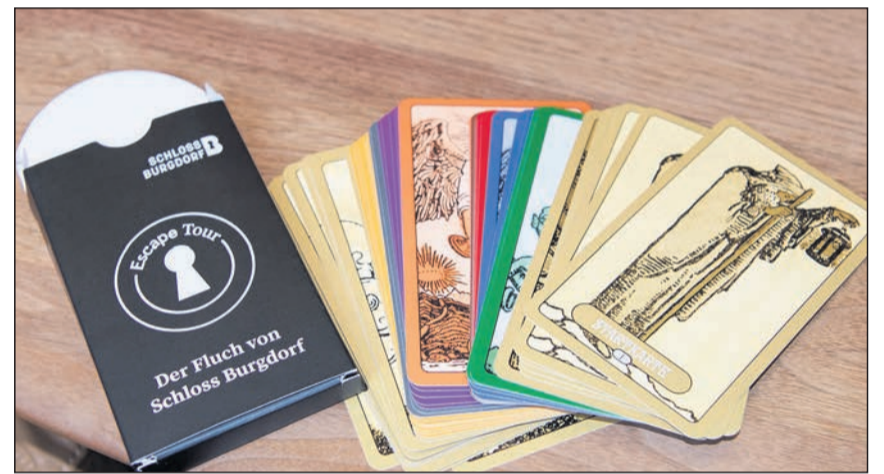
Mit diesem Kartenset beginnt das Abenteuer.