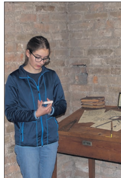
An diesem Pult gilt es ein Rätsel zu lösen. Die Stationen wurden von den Teilnehmenden gestaltet.

Eintritt Escape Tour: 10.– Franken zuzüglich zum Museumeintritt. Reservation eines Zeitfensters maximal einen Monat im Voraus unter Telefon 034 426 10 20. Mehr Informationen unter www.schloss-burgdorf.ch